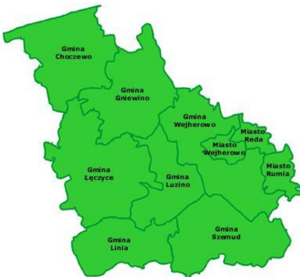
Rysunek 1. Zasięg terytorialny działania Powiatowego Urzędu Pracy w Wejherowie.

Powiatowy Urząd Pracy w Wejherowie obejmuje swoim zasięgiem działania trzy miasta Wejherowo, Rumie i Redę oraz siedem gmin: Wejherowo, Choczewo, Gniewino, Szemud, Linia, Luzino i Łęczyce.